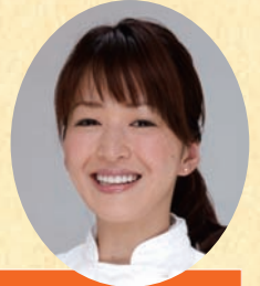
審査員 石井 秀代 (料理研究家)