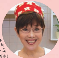
コンテスト 審査委員長 平野レミ (料理愛好家)