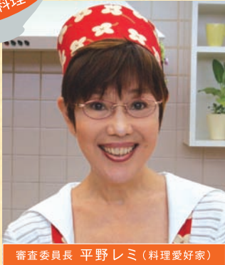
審査委員長 平野 レミ (料理愛好家)